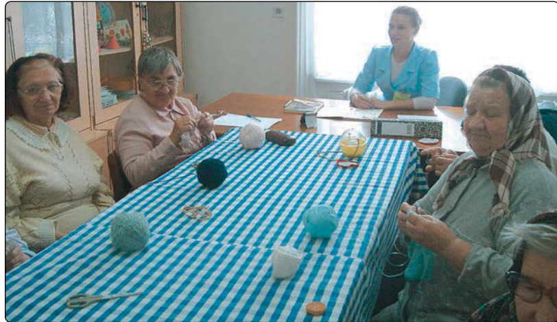
Energoterapie în grup la Centrul de de Îngrijire Asistență Variaș

Trei mese și două suplimente, unul dimineața la ora 10, iar celălalt seara la ora 20. Aici, sumele