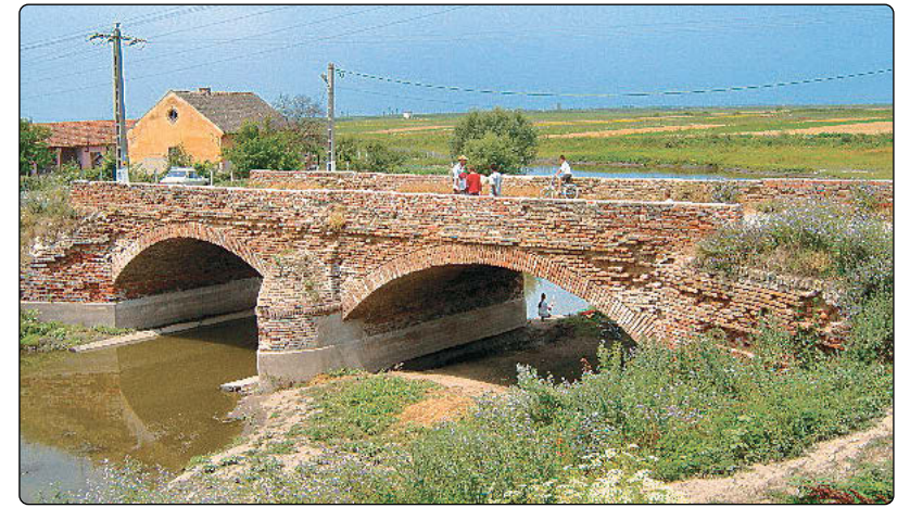
Podul de cărămidă construit la anul 1749 după planurile arhitectului W.Lechner