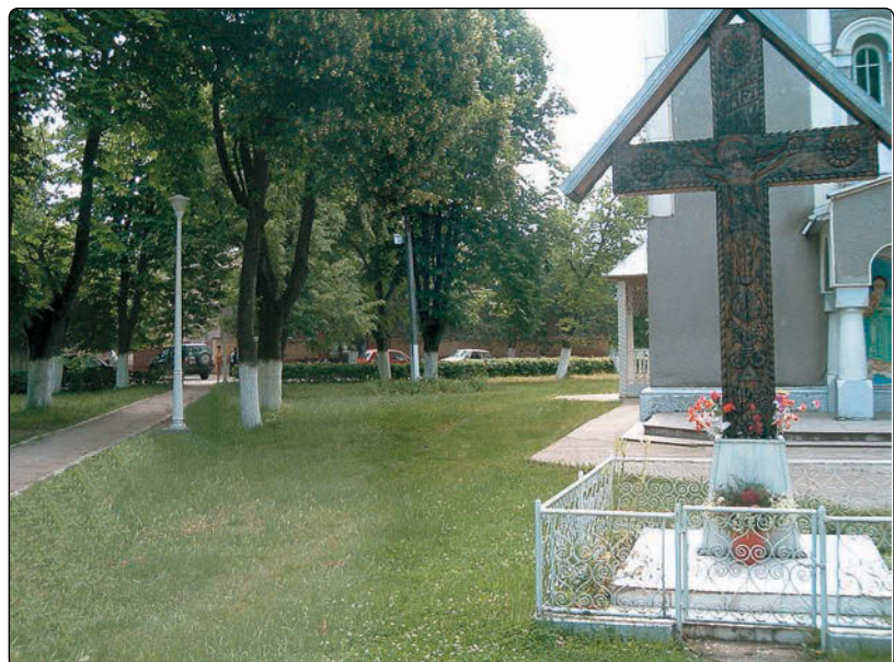
Parcul din centrul comunei Periam

Priorități sunt foarte multe, cele de care v-am spus, dar și cele de care nu v-am spus. Nu întotdeauna poți avea ca prioritate ceea ce vrei, ci pe cele la care poți să fii ajutat. La momentul acesta știu că există intenții bune dar cel mai tare mă doare problema apei, a canalizării și cea a școlii generale. În viitor comunele timișene trebuie să arate ca un orașel, pentru că a avea apă curentă și canalizare într-o comună mi se pare în secolul al XXI-lea absolut necesar.