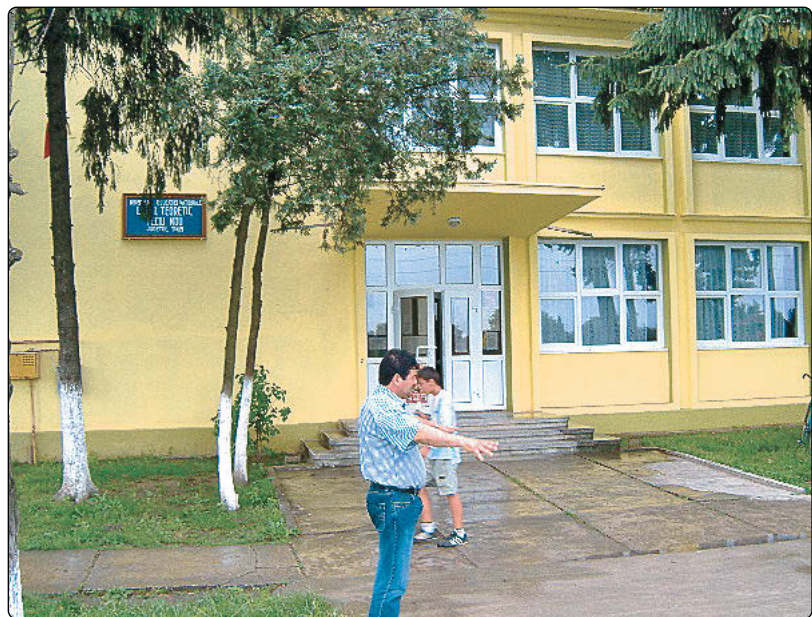
Liceul Teoretic din Peciu Nou (fațada)

Anul trecut am făcut o reparație capitală la stația de apă unde funcționa o singură pompă. Am pus pompe noi și am făcut un proiect de reabilitare pentru rețeaua de conducte. Iar până în 4-5 iulie