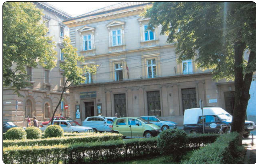
județ Timiș și locațiile sale.

O serie de monografii prezintă o sursă importantă de informații privind trecutul Banatului și al orașului Timișoara, cât și a altor localități și ținuturi din țara noastră. Merită să fie menționate monografiile comitatelor din Ungaria istorică, respectiv ale Banatului și Transilvaniei, grupate în lucrarea intitulată Magyarország varmegyei és városai îngrijită de Samu Borouszky și editată în perioada anilor 1896 – 1911 în mai multe volume de calitate, având coperte frumoase desenate, conținând reproduceri valoroase, reprezentând imagini din diferite locații. Cartea este apreciată și solicitată de mulți cititori, în special de istorici și muzeografi. Două volume au ca subiect actualul