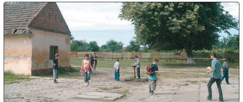
Clădirea școlii generale e revendicată de Episcopatul romano-catolic

mare. Cunosc foarte multe persoane care sunt la vârsta de 52-54 de ani. Acestea nu se pot pensiona dar nici nu le mai angajează nimeni, pentru că au vârsta care o au. Sunt persoane care nu au venituri de nici un fel. La noi în localitatea Periam există în jur de 160 de dosare pentru a primi ajutor social, în timp ce municipiul Timișoara are doar 200. La categoria persoane cu dizabilități avem 60 de dosare. Ne confruntăm cu o problemă socială destul de gravă. Absolut toate pornesc de la bani și noi cu bugetul stăm foarte prost pentru că nu avem surse și nici nu le putem crea, deocamdată. Nu suntem încă o comună atractivă pentru investitorii străini.