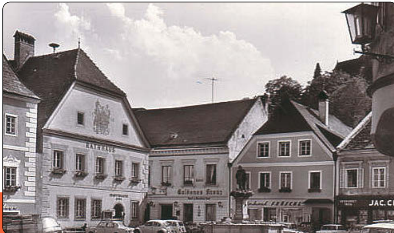
Teatrul de Stat din Grein