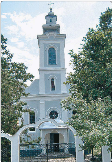
Biserica ortodoxă română (1875)

Până la inundații o bună parte din populație a trăit din agricultură. În comună au existat aproximativ 70 de tractoare, satul Cruceni avea în jur de 100, la 4000 de hectare. Asta până în 20 aprilie 2005, dată care a schimbat total viața comunei Foeni. Digul unde s-a deversat apa nu a fost pe teritoriul comunei noastre, ci pe teritoriul localității Giulvăz, în amonte de Foeni, dar cu toate acestea noi ne-am implicat, obligația noastră fiind ca în cazuri de alertă, împreună cu Apele Române, să păzim digul. După această tragedie s-a trecut la reconstrucția sutelor de case distruse. Până acum s-au refăcut 300