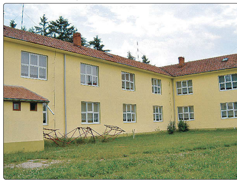
Curtea interioară a liceului