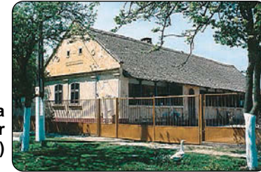
Casa Simion Ghibaur (1913)