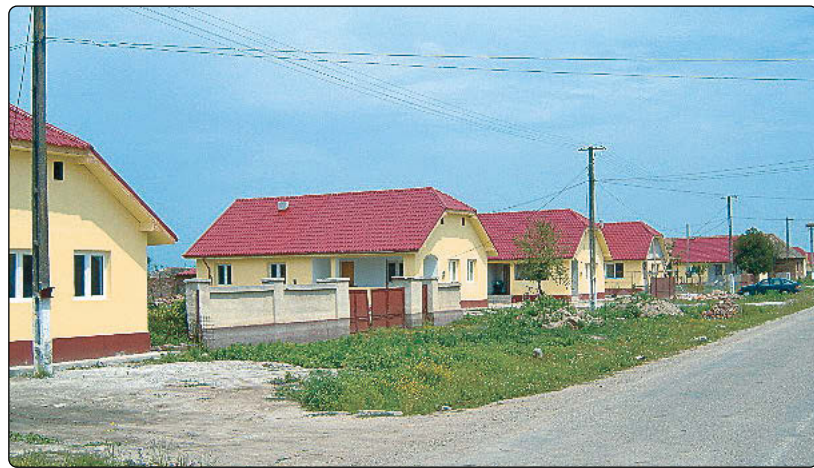
“Strada caselor noi”